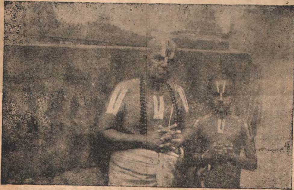
— ஸ்விக்குதபுத்ரேண ஸஹ —

அடியேனுக்கு இரண்டு குமாரிகள் மட்டும் பிறந்து வாழ்கின்றனர். கனிஷ்ட குமாரிக்கு இரு குமாரர்களும் ஒரு குமாரியும்; பிறகு ஜ்யேஷ்ட குமாரிக்கு இரு